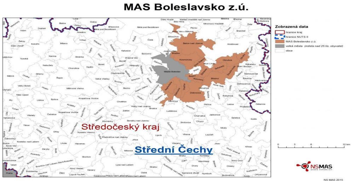
Obrázek 1 Území působnosti MAS Boleslavsko v kontextu regionů NUTS2 a NUTS3

Území působnosti MAS Boleslavsko je ve Středočeském kraji, regionu soudržnosti Střední Čechy.